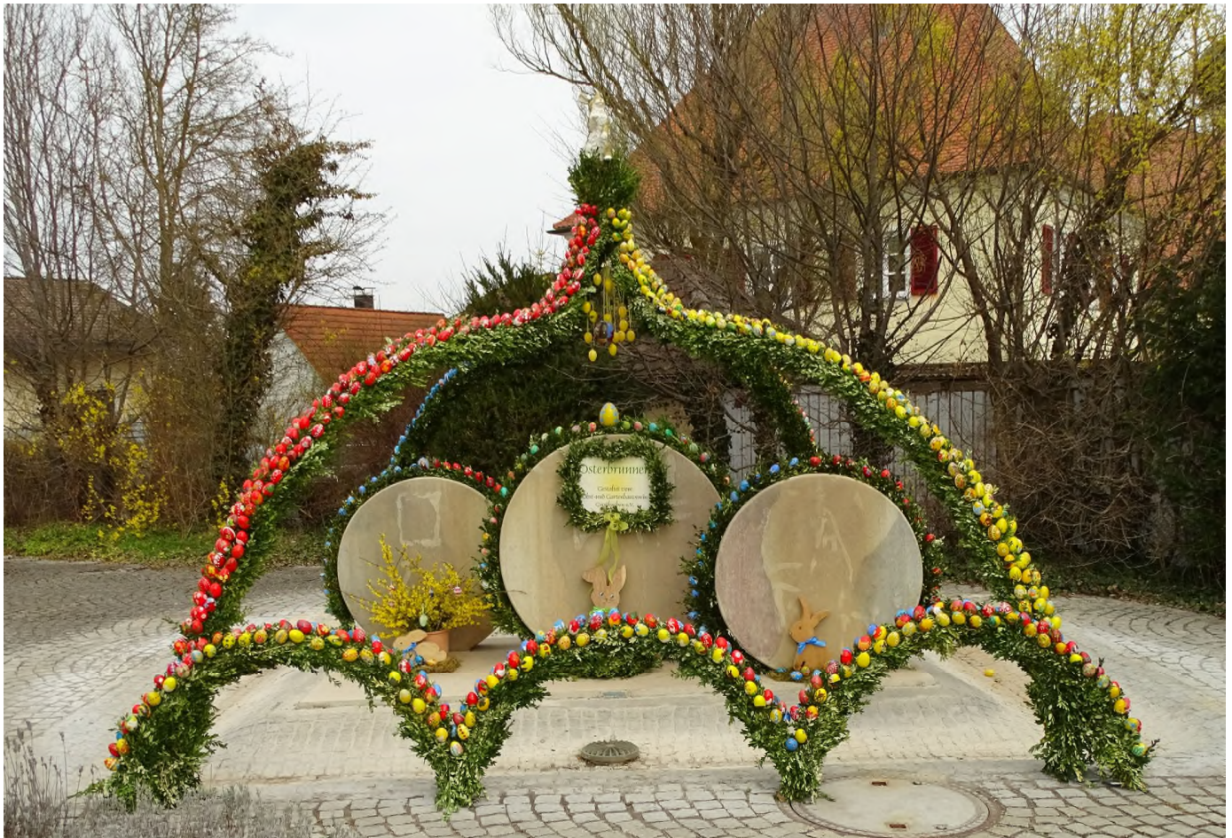
Bild: Osterbrunnen in Großkuchen

Viele fleißige Hände vom Obst- und Gartenbauverein Großkuchen haben einen sehr schönen Osterbrunnen gestaltet.