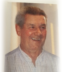
24. April 1939 - 25. Dezember 2021